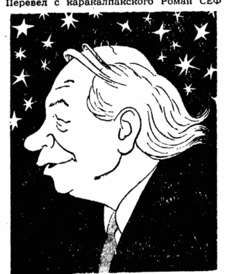
Сергей Бородин Рисунки худ. И. ИГИНА